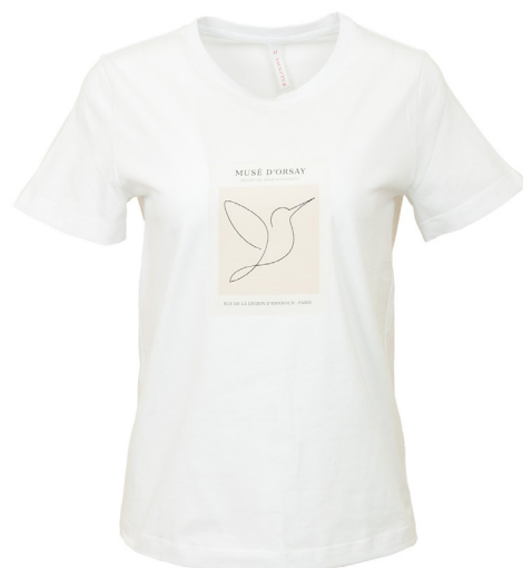
Футболка 8-11/21,8063-0F Футболка базовая, из хлопковой кулирки, с принтом. / 42-54 /