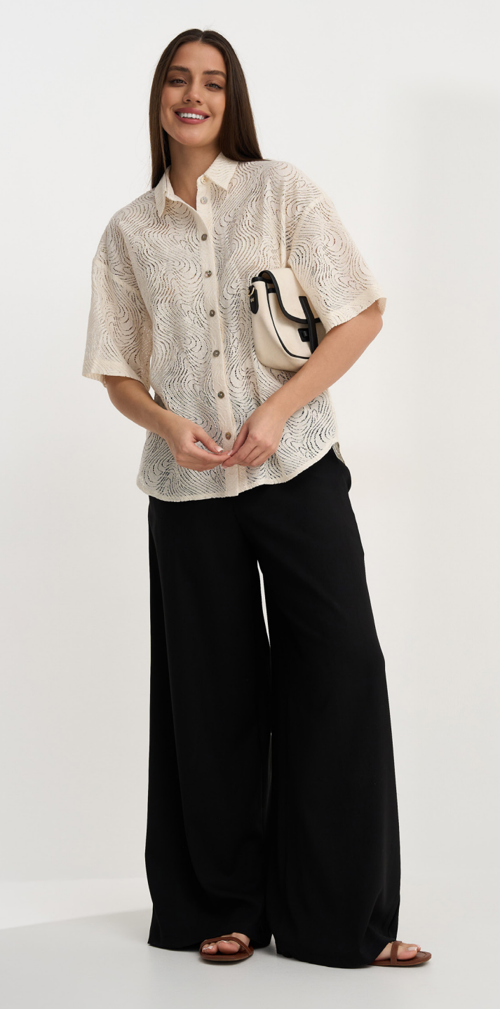
Рубашка 6-400-1,5070-0v Рубашка с коротким рукавом, из фактурной ткани. / 42-54 /