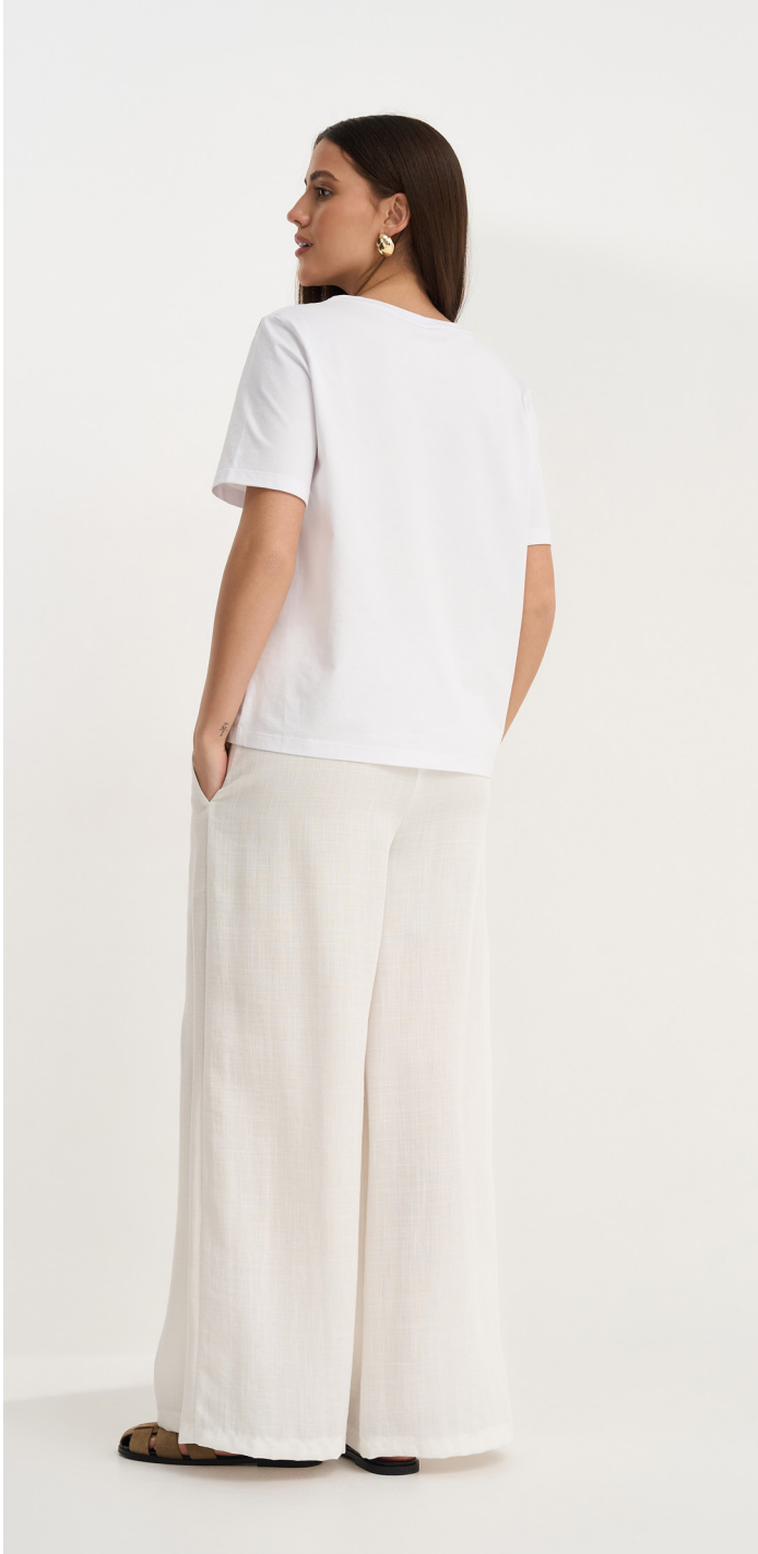
Футболка 8-12/19,8063-0F Футболка с принтом, из хлопковой кулирки. / 42-54 /