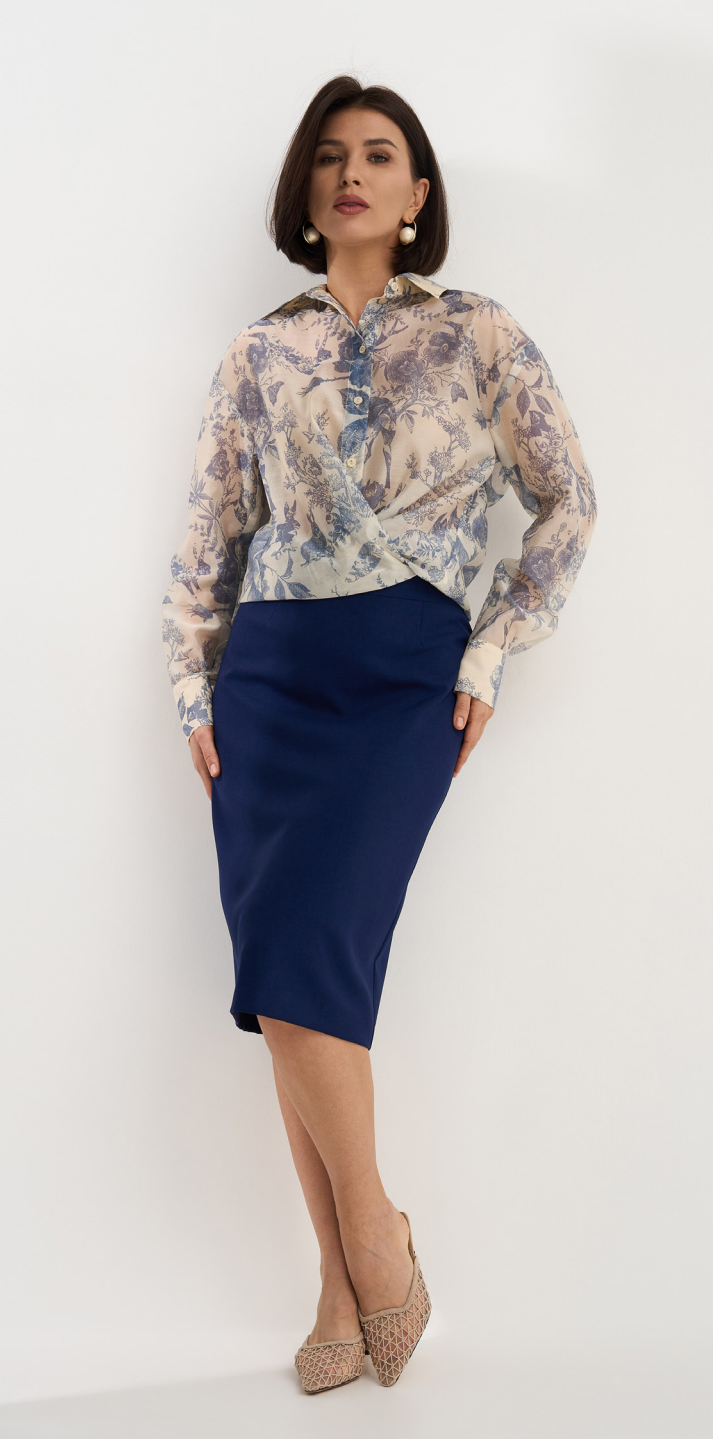
Блузка 6-457,7065-8v Блузка свободного кроя. / 44-54 /