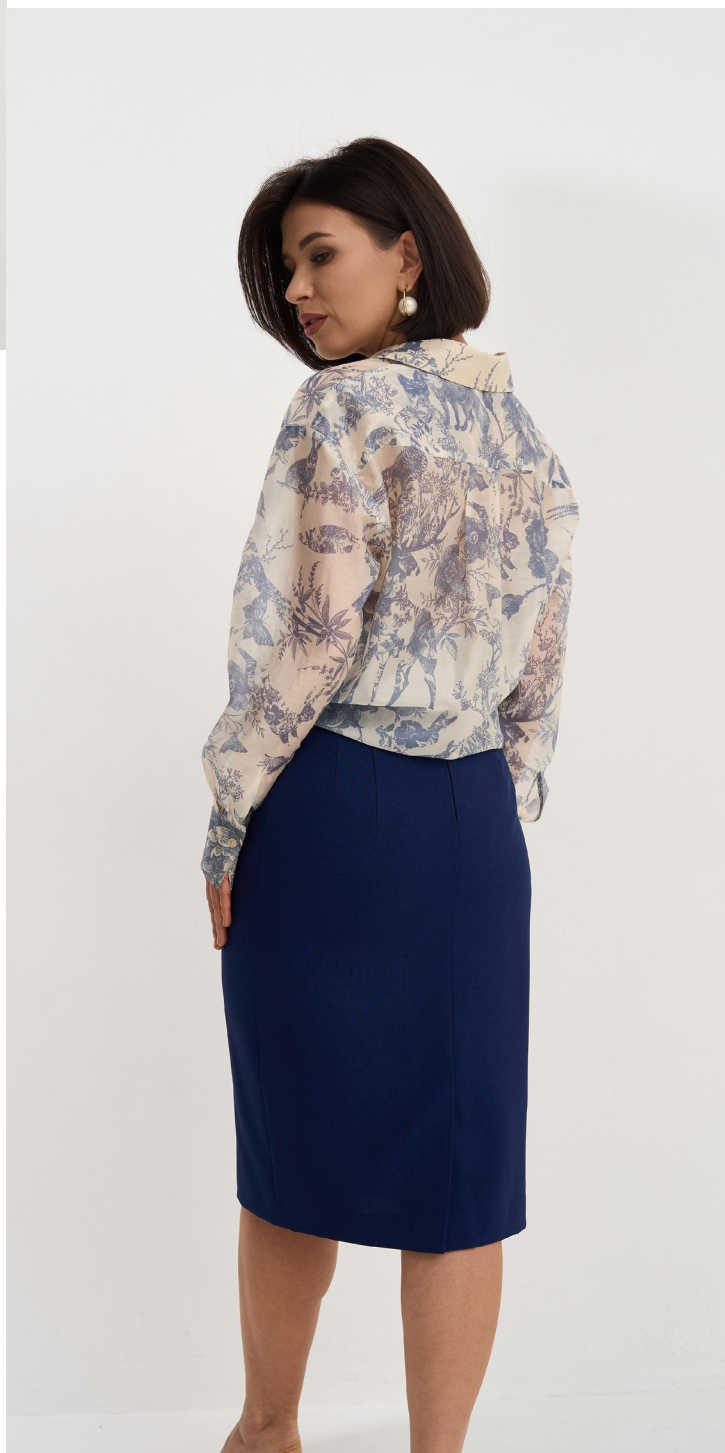
Юбка 1-378,2004-2-7 Юбка из лёгкой смесовой с хлопком немнущейся ткани, длина 75 см, подклад. / 42-54 /