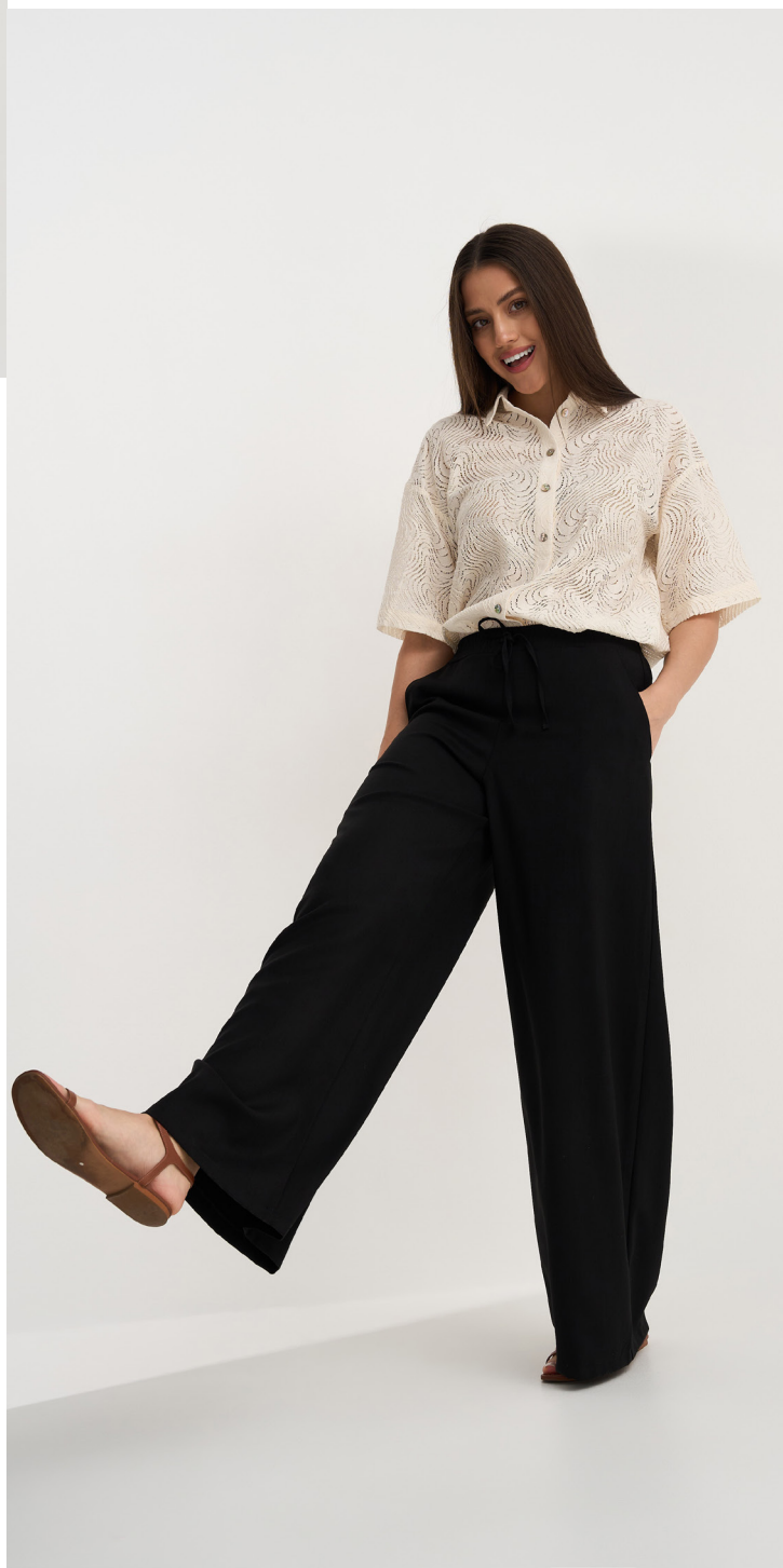
Брюки 2-659,2058 Легкие широкие брюки-палаццо, резинка и кулиска в поясе, глубокие карманы. / 44-52 /