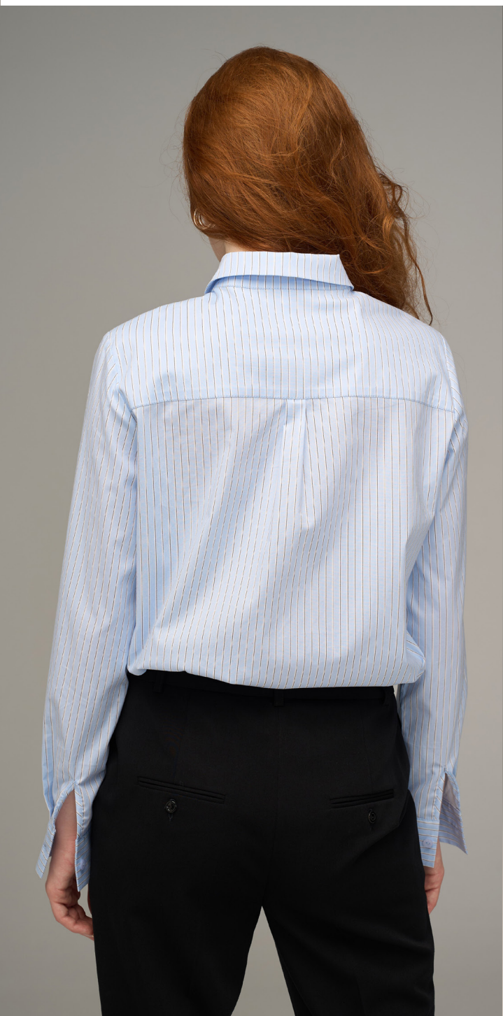
Брюки 2-513-1,2059-1 Брюки укороченные, зауженные книзу, разрезик по низу, из вискоз- ной костюмной гладкоокрашенной ткани, черного цвета. / 42-54 /