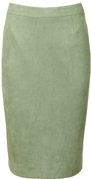
Юбка 1-378,8114-4-1 Юбка прямого силуэта, длина 70±2 см, подклад, из мягкой ткани с бархатистой поверхностью. / 42-54 /