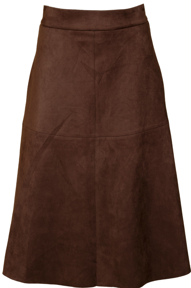
Юбка 1-346,8010-26 Замшевая юбка А-образного силуэта. / 42-52 /