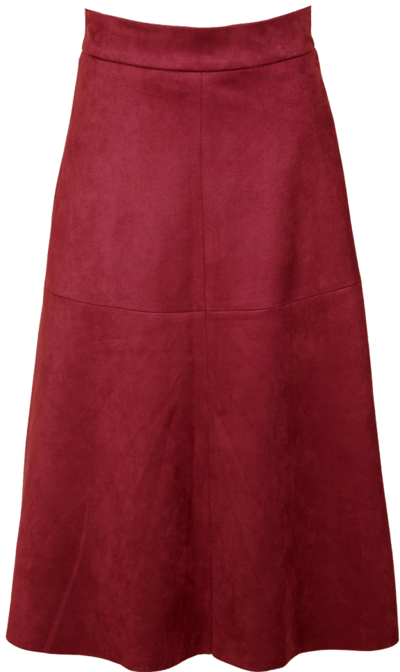
Юбка 1-346,8010-22 Замшевая юбка А-образного силуэта. / 42-54 /